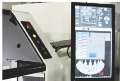
大型タッチパネル