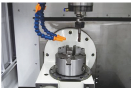
傾斜円テーブル (三爪チャック取り付け例)