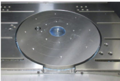
内蔵型円テーブル